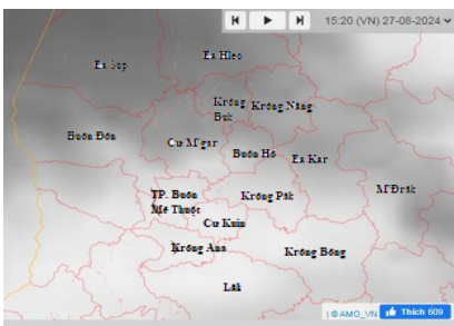
Hình 1: Ảnh vệ tinh tại khu vực tỉnh Đắk Lắk

Qua theo dõi trên ảnh Ra đa thời tiết Pleiku, ảnh mây vệ tinh và định vị sét cho thấy những vùng mây đối lưu tồn tại và phát triển trên khu vực huyện Cư Kuin, Krông Pắc, Krông Ana, Lắk. Hiện tại mây dông đang tiếp tục phát triển và mở rộng.