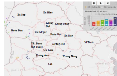
Hình 3: Ảnh định vị sét tại khu vực tỉnh Đắk Lắk