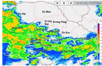
Hình 2: Ảnh ra đa tại khu vực tỉnh Đắk Lắk