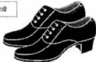
Giày vải chiến sự